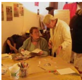
Atelier d'art thérapie