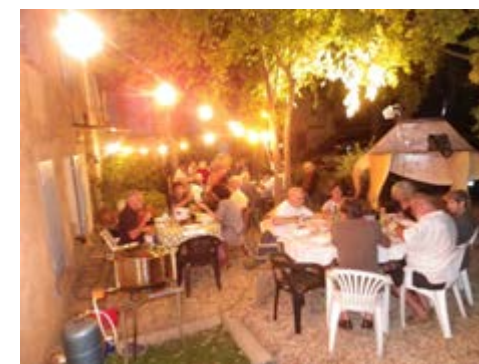
Faire la fête