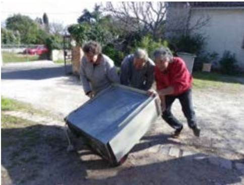
On débarrasse...on nettoie... on laisse place nette pour les maçons.

Le 3 juin 2016, la coopérative « La maison OASIS » est née !