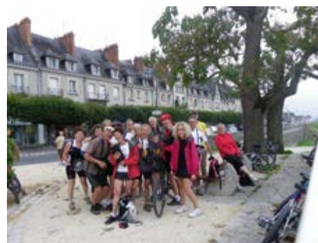
Découvrir la Loire à vélo