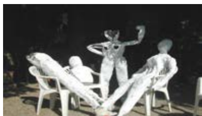
Atelier d'art plastique