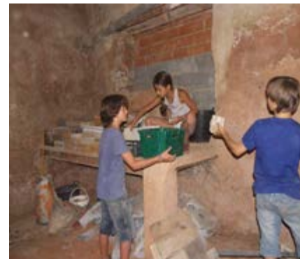
Les enfants vident l'ancienne cave d'argile