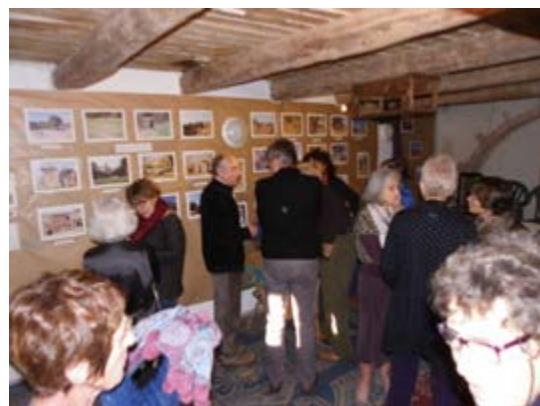
Solidarité: Exposition et vente d'artisanat malien pour financer l'accès à l'eau en milieu rural.