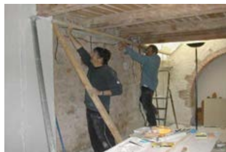
Des chantiers participatifs pour réhabiliter les locaux associatifs