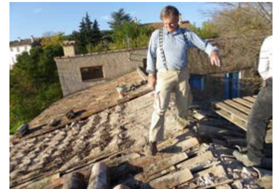
On refait de l'étanchéité de la toiture